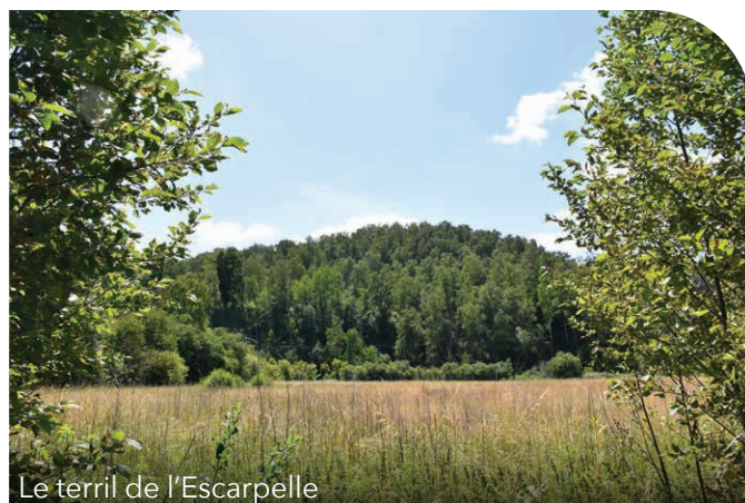
Le terril de l'Escarpelle