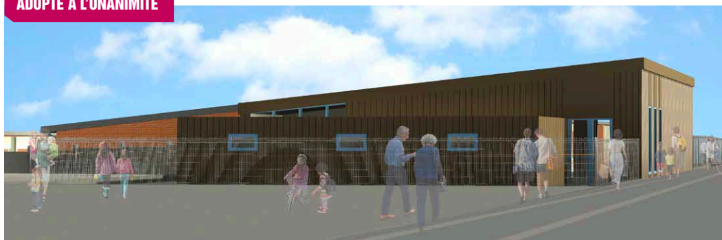
Projet de la salle d'évolution sportive au groupe scolaire de Belleforière