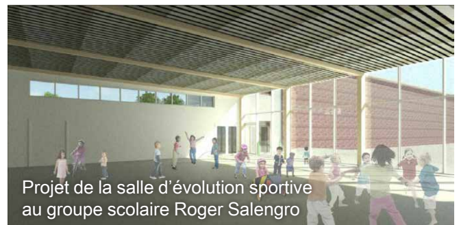
Projet de la salle d'évolution sportive au groupe scolaire Roger Salengro