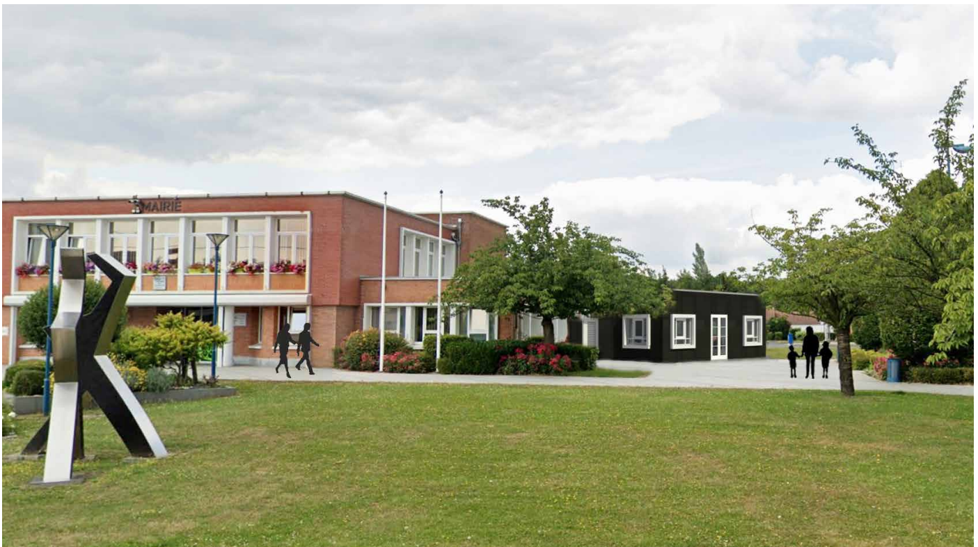
Projet d'extension de la mairie