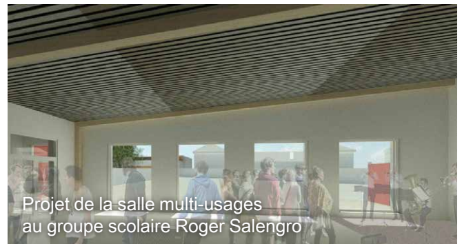
Projet de la salle multi-usages au groupe scolaire Roger Salengro