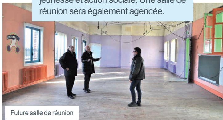
Future salle de réunion

À l'étage du bâtiment enfance jeunesse seront prochainement créés des bureaux pour regrouper dans un même lieu les personnels des services enfance jeunesse et action sociale. Une salle de réunion sera également agencée.